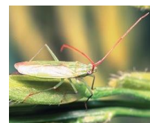
アカヒゲホソドリカメムシ

◎1人で農作業に出かける場合は、万が一に備えて、家族に行先や帰宅時間を告げておくとともに、携帯電話を身に着けるなどの対応を取りましょう。