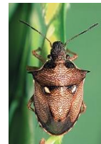
オオトゲシラホシカメムシ

今回の調査では、トビイロウンカの発生は確認されませんでした。しかし、梅雨前線と共に飛来している可能性があります。成熟期の遅い品種では、トビイロウンカの発生・増殖により、「 坪枯れ 」に発展する可能性があります。 出穂前の基幹防除は必ず実施しましょう。