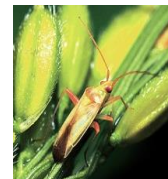
アカスジカメムシ

「 出すくみ症状 」や「 ゆうれい症状 」の株を見つけたら、 株ごと抜き取り、ほ場の外に持ち出して処分しましょう。 発生を確認したほ場は、 出穂前に防除を実施し、ヒメトビウナカの密度を抑えましょう。