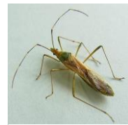
クモヘリカメムシ

葉色の濃い所や日当りの悪い所では「穂いもち」に進展することがあります。ヒノヒカリなどの普通期品種では、出穂前にいもち病が目立つことがありますので、観察しましょう。 発生している場合は穂肥の減肥や無施肥などの対策を、特に多発している場合は出穂前に治療効果の高い薬剤で防除しましょう。