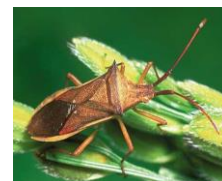
ホソハリカメムシ

県下で多発生が確認され、定点畦畔でも確認されています。「 斑点米 」の原因になりますので、 出穂後の薬剤防除を徹底しましょう。 雑草が繁茂している場所で繁殖しますので、 休耕田や池の堤等の草刈りで、生息地を減らしましょう。 ただし、 出穂期の畦畔の草刈りは、かえって水田に虫を追い込むこととなりますので、出穂2週間前までに草刈りを終わらしましょう。 また、 穂揃期頃に防除を実施しましょう。