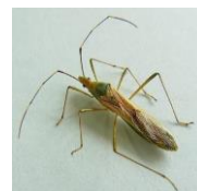
クモヘリカメムシ