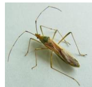
クモヘリカメムシ