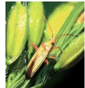
アカスジカスミカメ