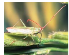
アカヒゲホソドリカスミカメ