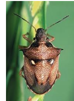
オトゲシラホシカメムシ